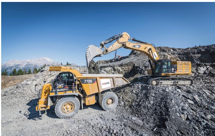
A nyersanyag-kitermeléstől a feldolgozásig a roxit átfogó termék- és szolgáltatáskínálata az építőipari értéklánc legfontosabb szakaszait fedi le.